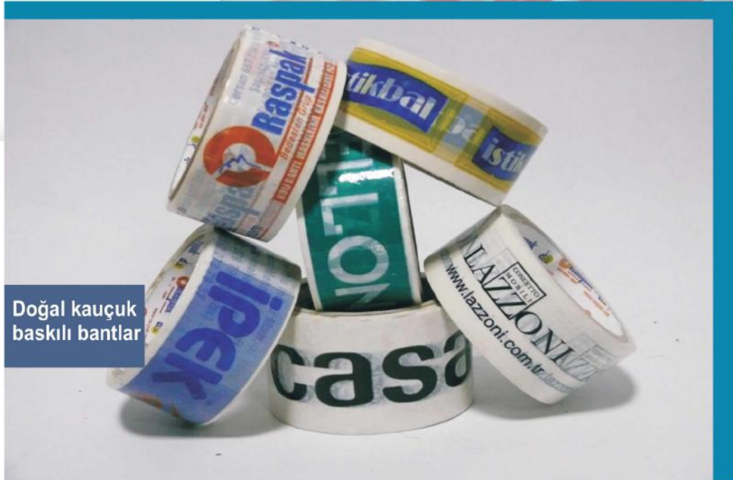
Doğal kauçuk baskılı bantlar

Since 2004, with the flashy performance, the latest system has reached 500,000 m2 capacity with monthly flexo printing machines. storage and shipment as a classifier option. All packaging tapes can be applied as well as deformation can be made on a paper tape. Logo and Graphic team work is done by our team of experts can work on 6 colors